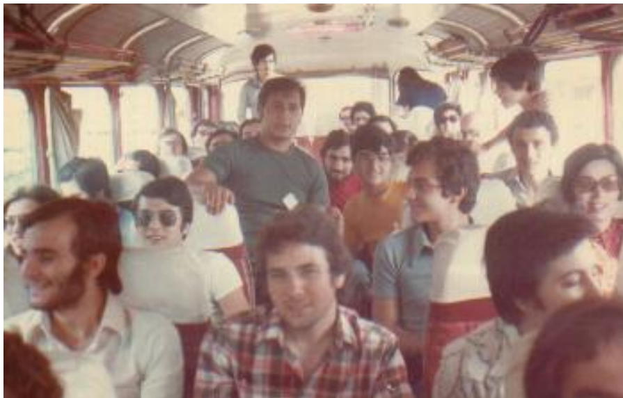
una gita durante il convegno estivo di Taranto