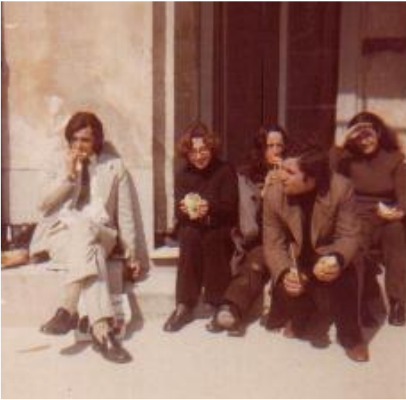
Un'immagine dal convegno di Avellino, preparatorio dell'incontro di Sorrento