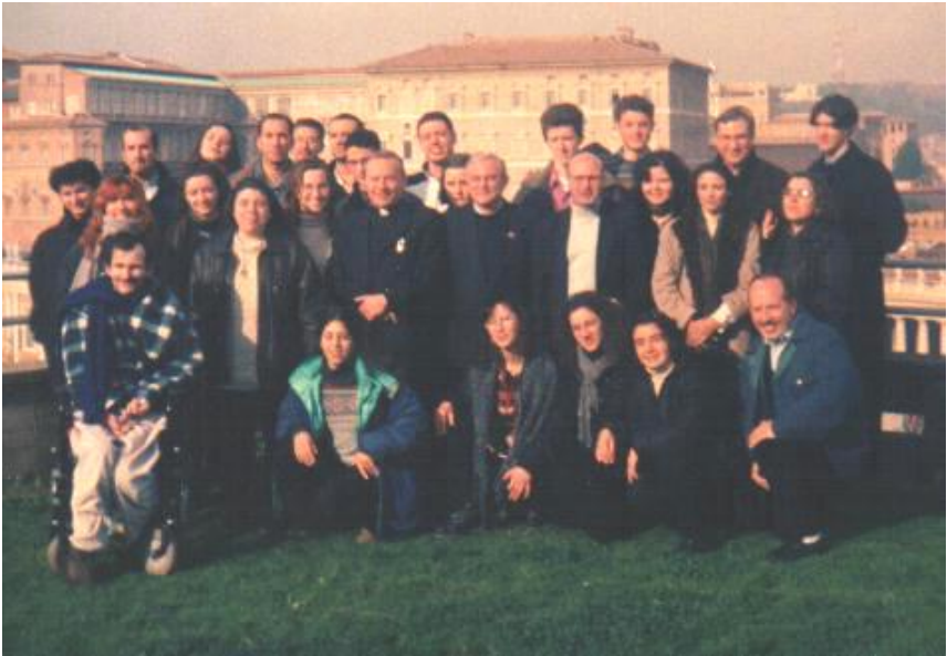
una foto dell'incontro di segreteria di inizio anno