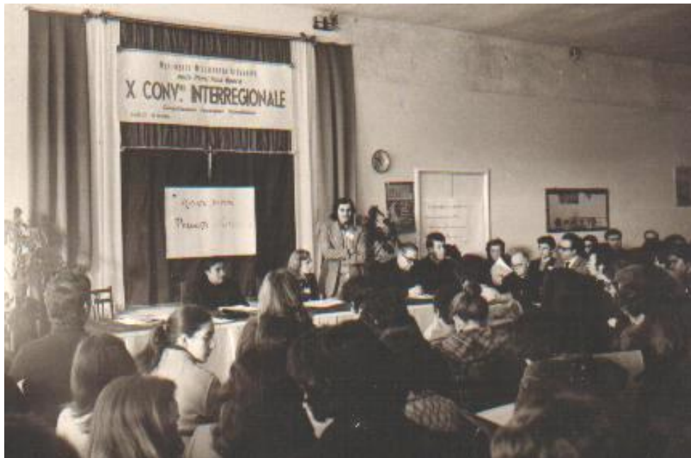
convegno interregionale di Amalfi